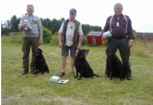
Pokalvinder og de to andre.